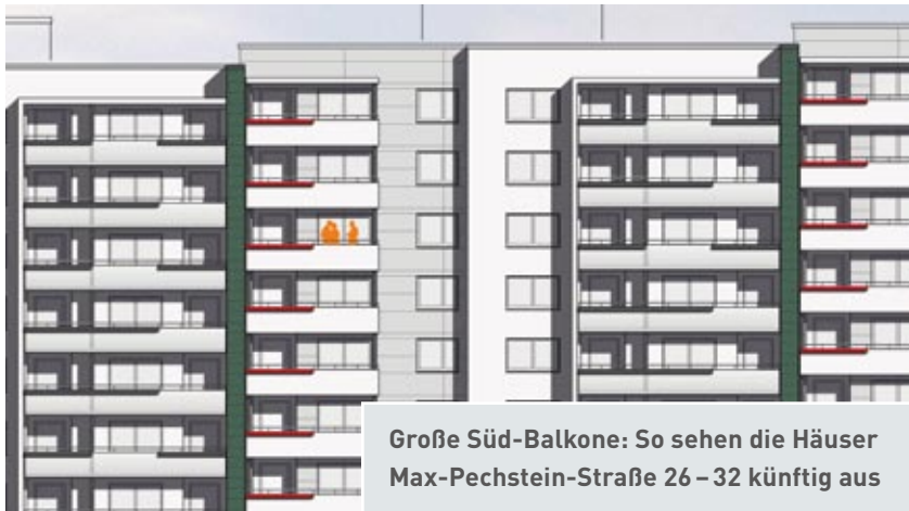
Große Süd-Balkone: So sehen die Häuser Max-Pechstein-Straße 26 – 32 künftig aus

Die Bergedorf-Bille eG hat die Modernisierung ihrer Wohnanlage Hollkoppelweg 13–19 fast abgeschlossen. Das Gebäude hat eine Wärmedämmung und neue Fenster erhalten. Außerdem wurden die Heizungen ausgetauscht. Als nächstes modernisiert die Genossenschaft in der Max-Pechstein-Straße 26–32. Auch hier wird etwas für den Klimaschutz getan. Das Haus bekommt aber nicht nur eine bessere Wärmedämmung. Auch die Balkone werden vergrößert. Für beide Vorhaben mit insgesamt 269 Wohnungen investiert die Bergedorf-Bille eG mehr als 7,5 Mio. Euro.